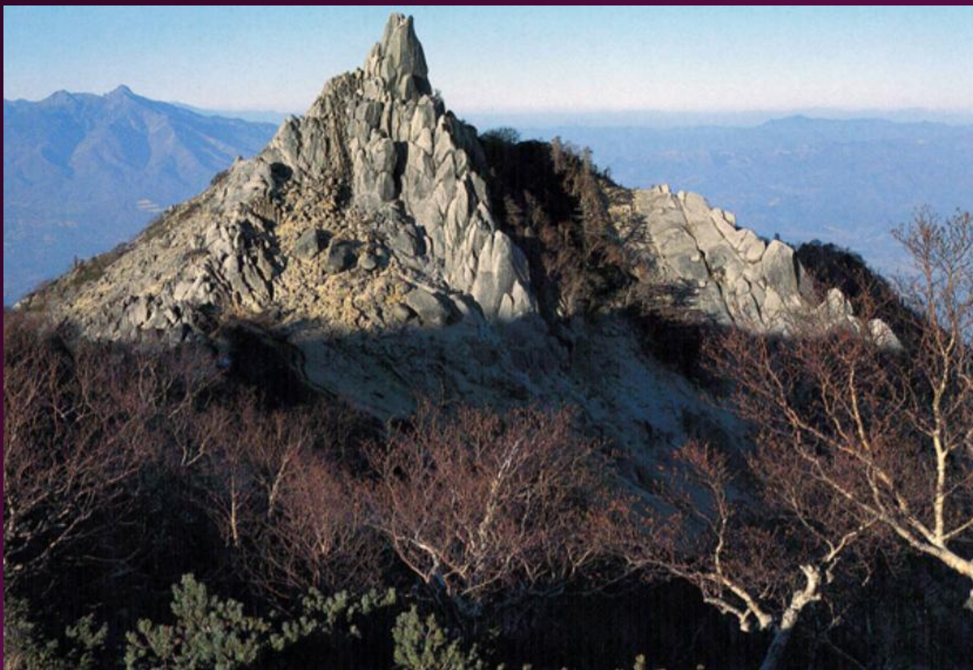
鳳凰山 地藏岳 2,764m