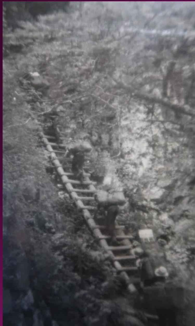
南アルプス 駒ヶ岳