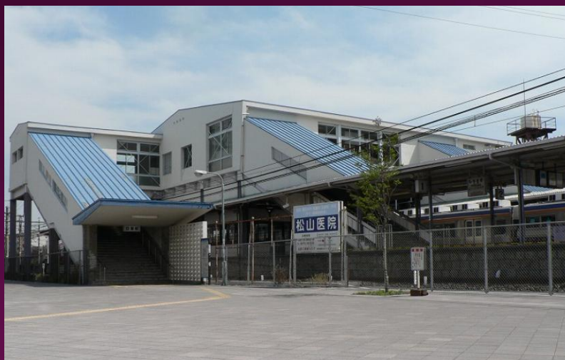
南海電車 高野線 白鷺駅