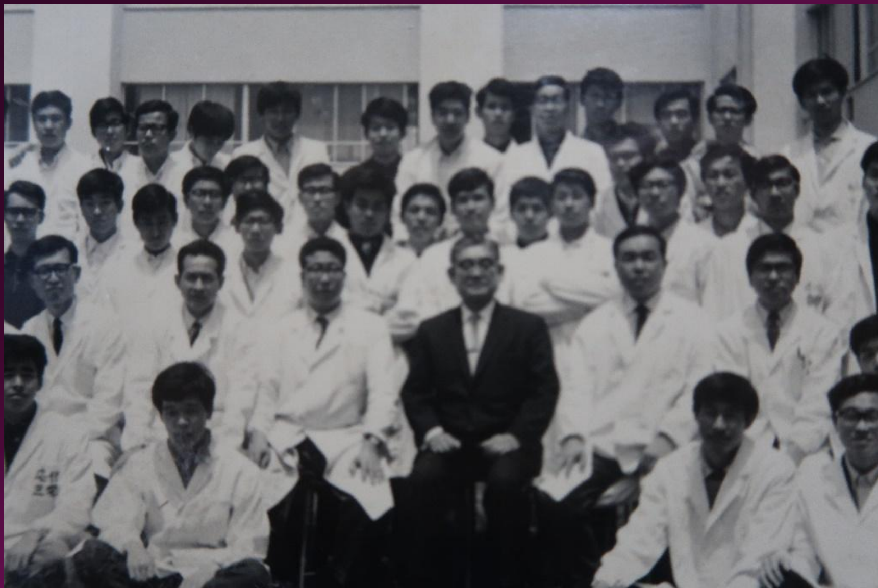
大阪府立大学 工学部 応用化学科