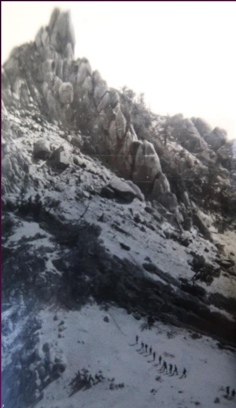
南アルプス 地藏が岳の オベリスク