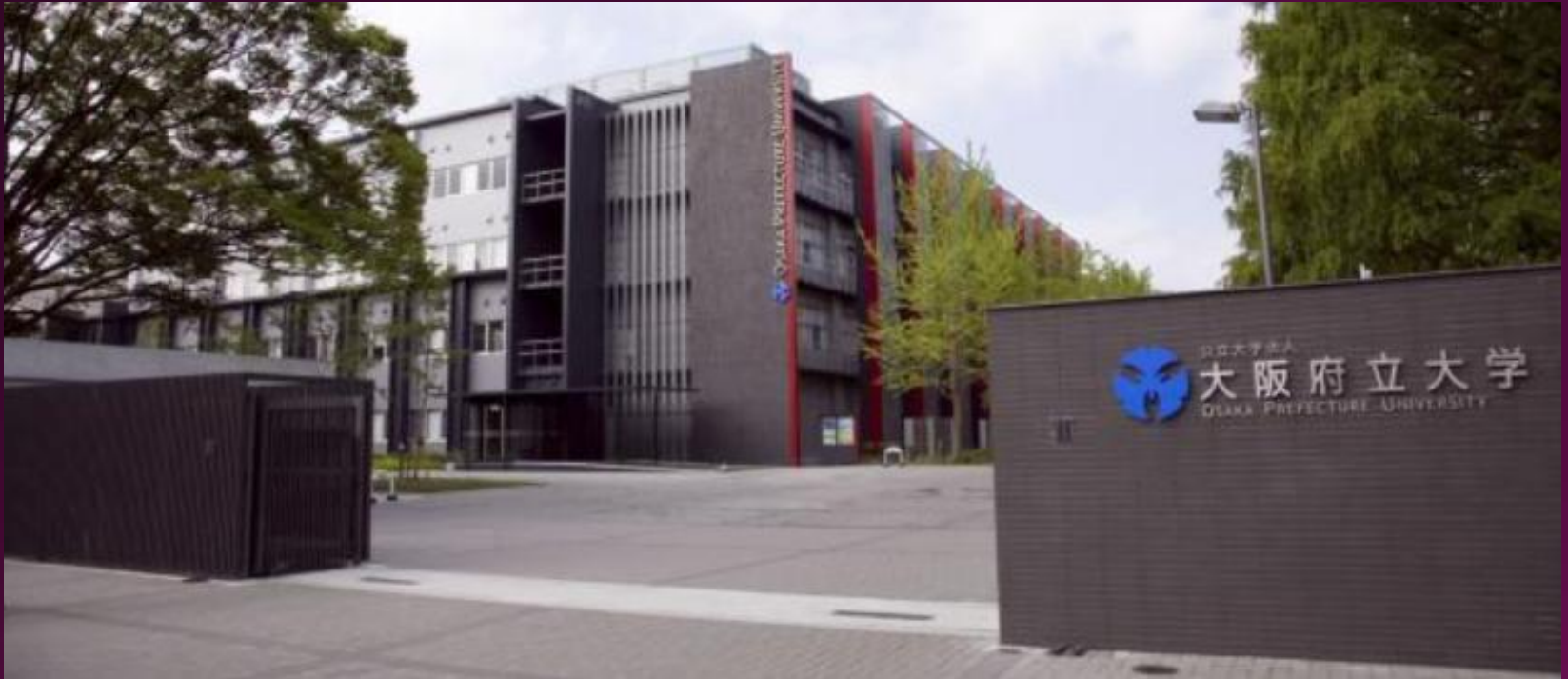
大阪府立大学 中百舌鳥キャンパス