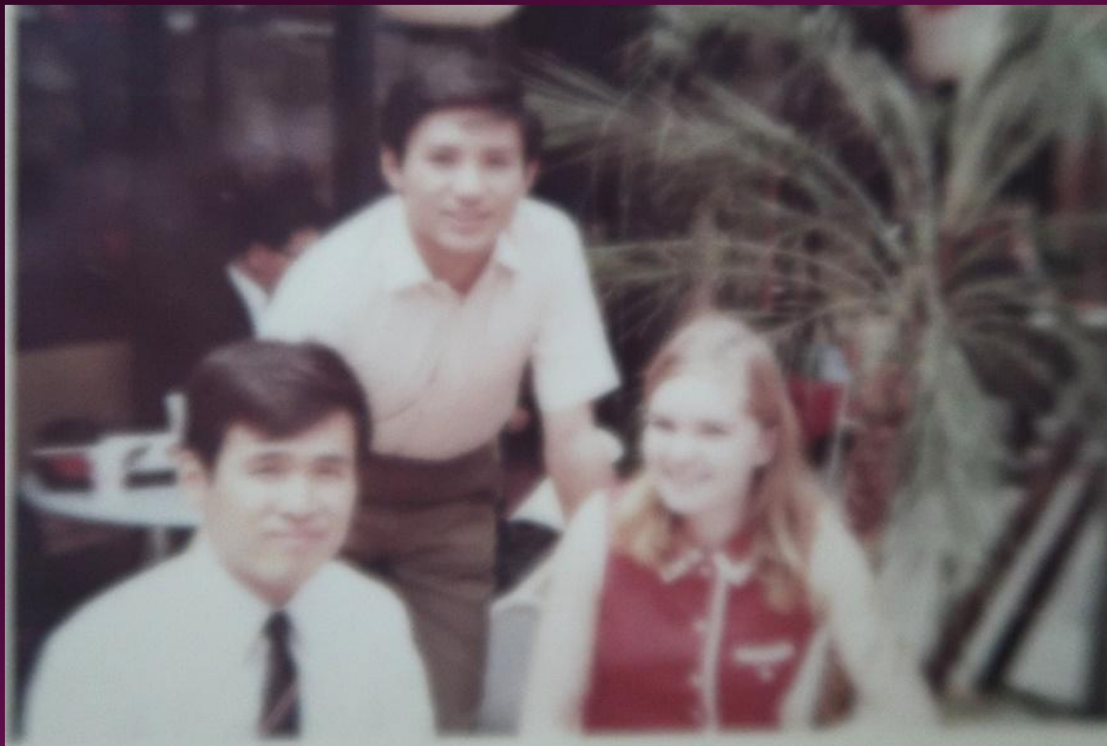
学友とサリーさん