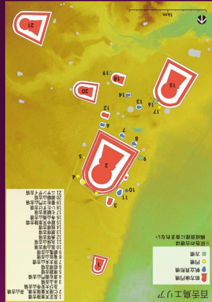
密集した多様な古墳 百舌鳥古墳群