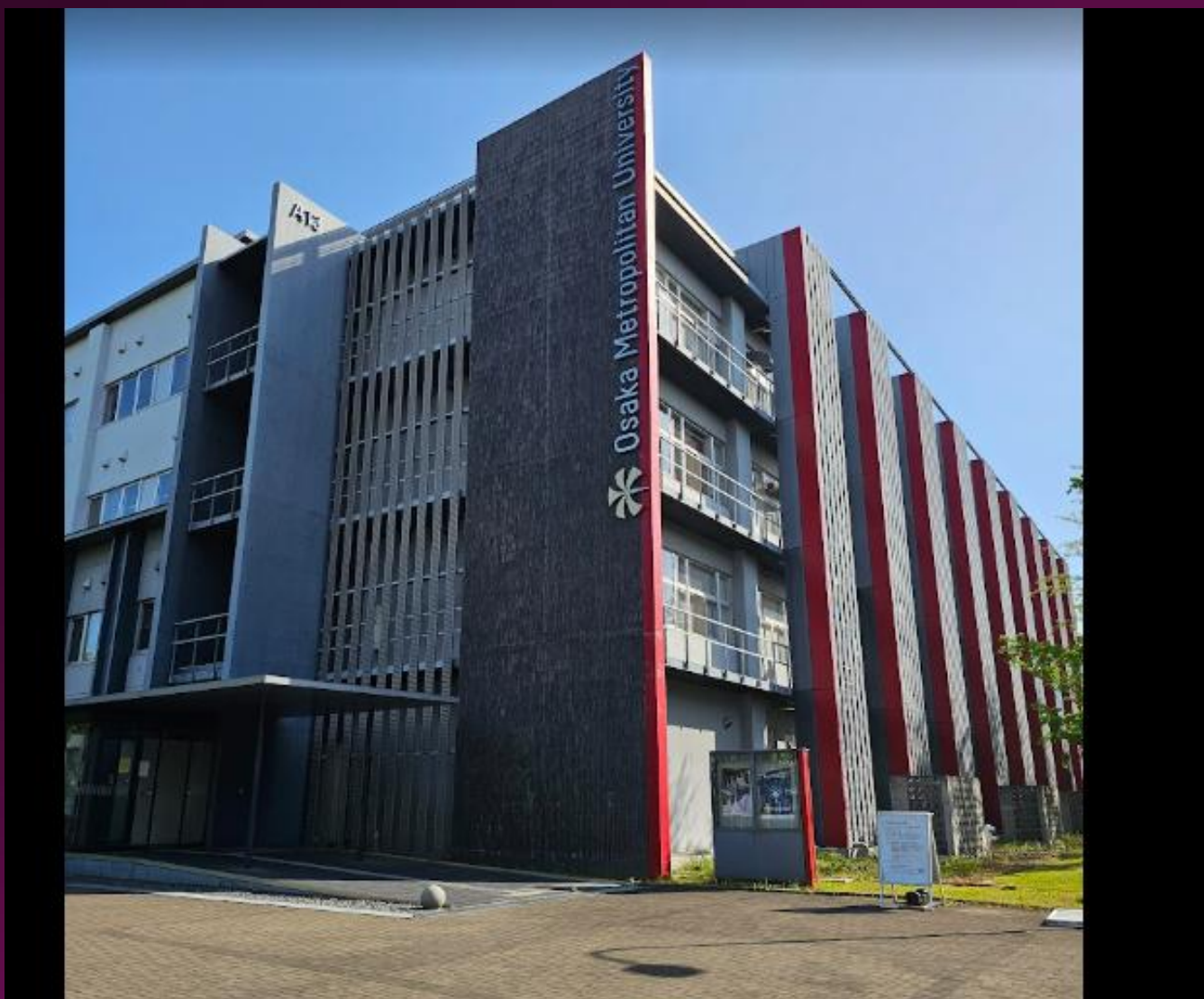
大阪府立大学 現在大阪公立大学