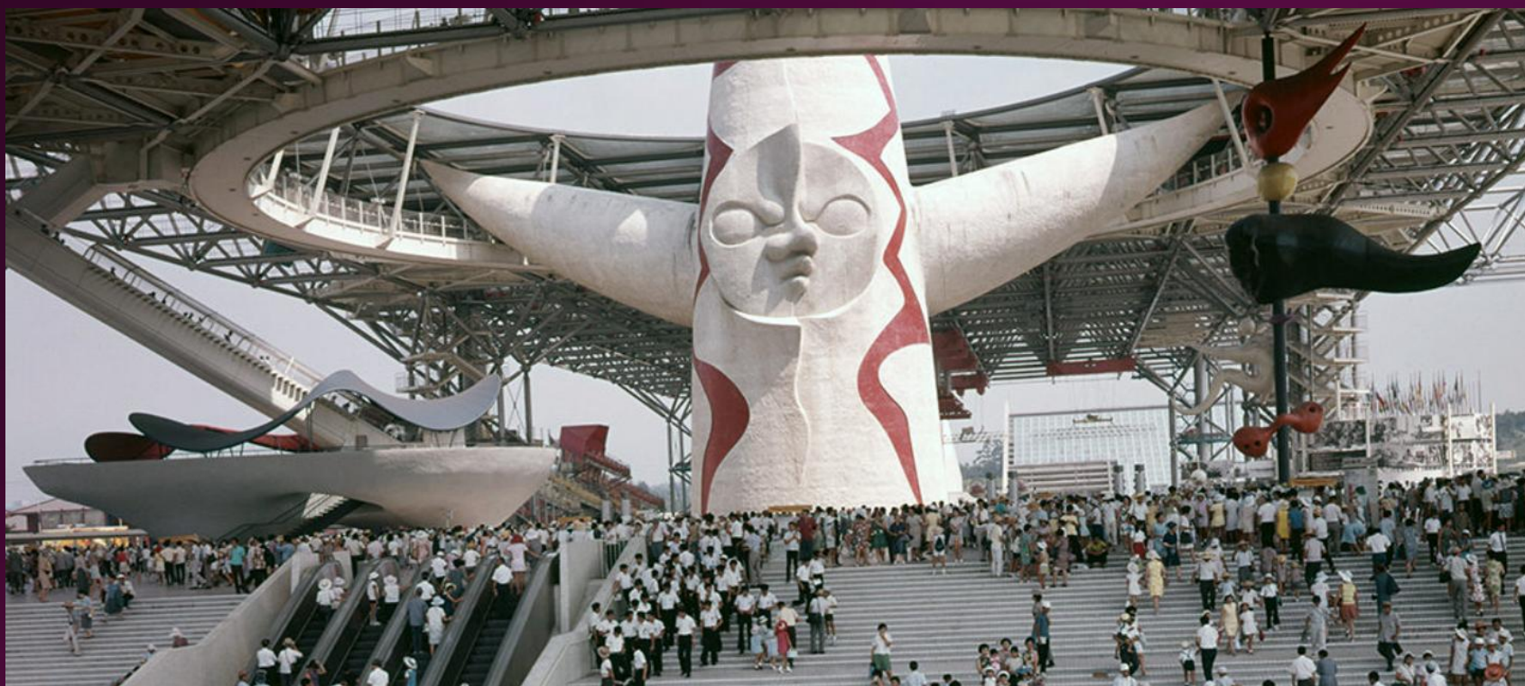
大阪 万国博覧会 太陽の塔