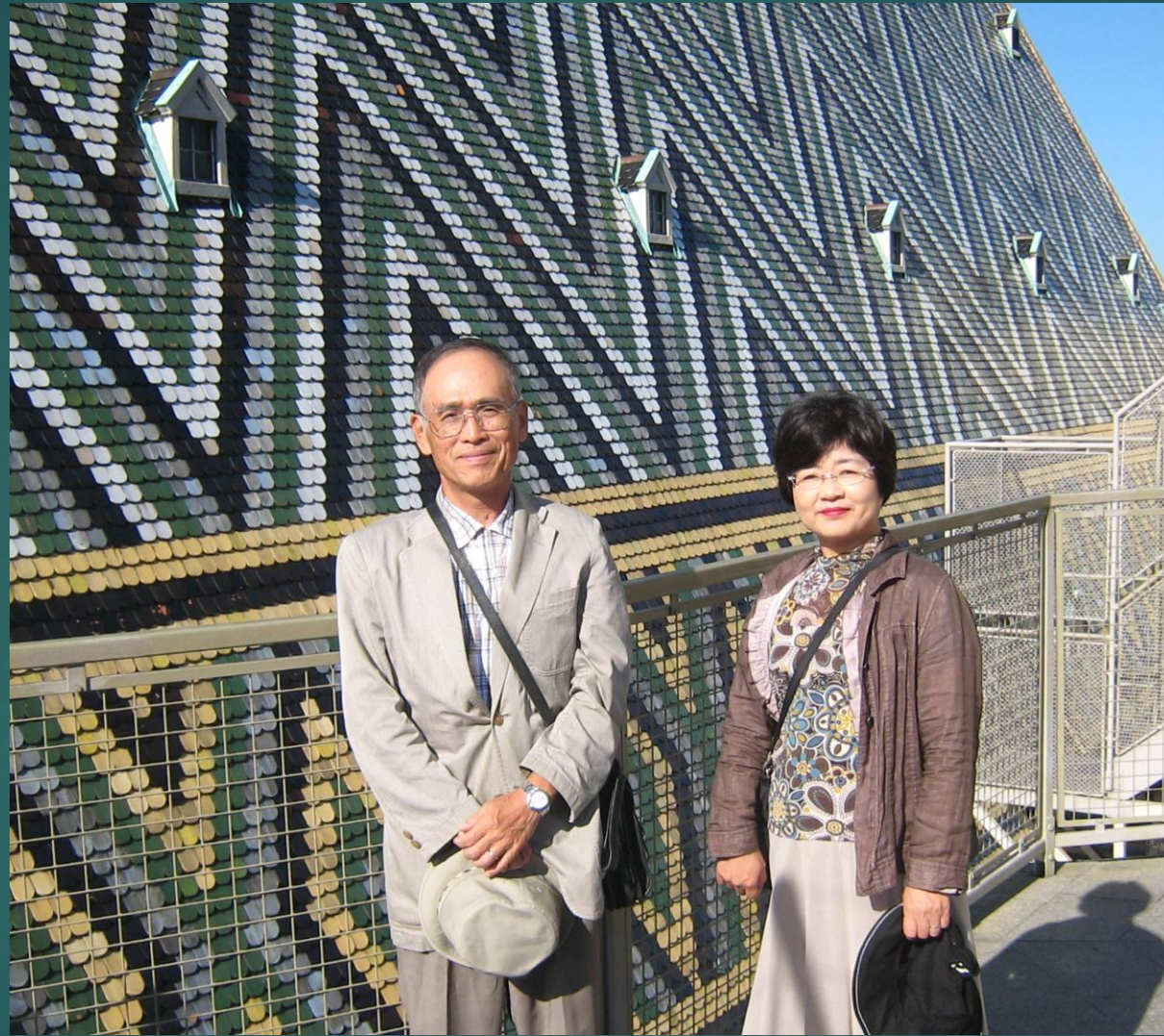
ウィーン シュテファン大聖堂