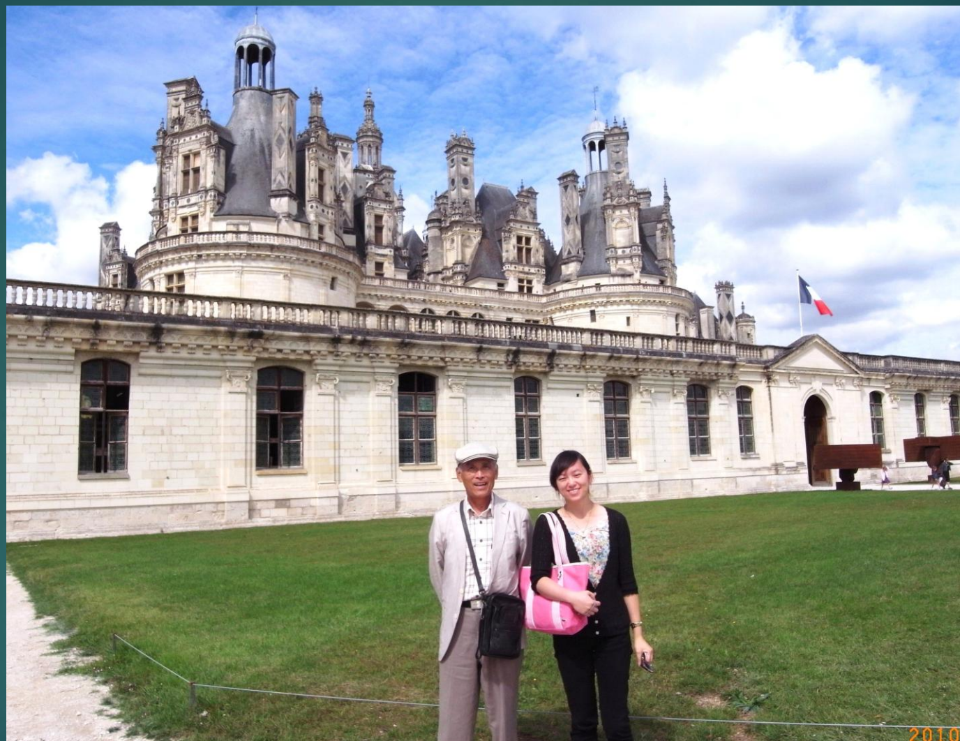
フランス シャンボール城