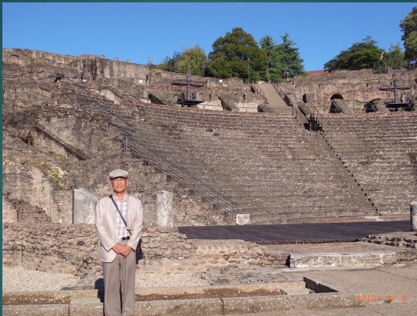
古代ローマ 円形劇場(リヨン)