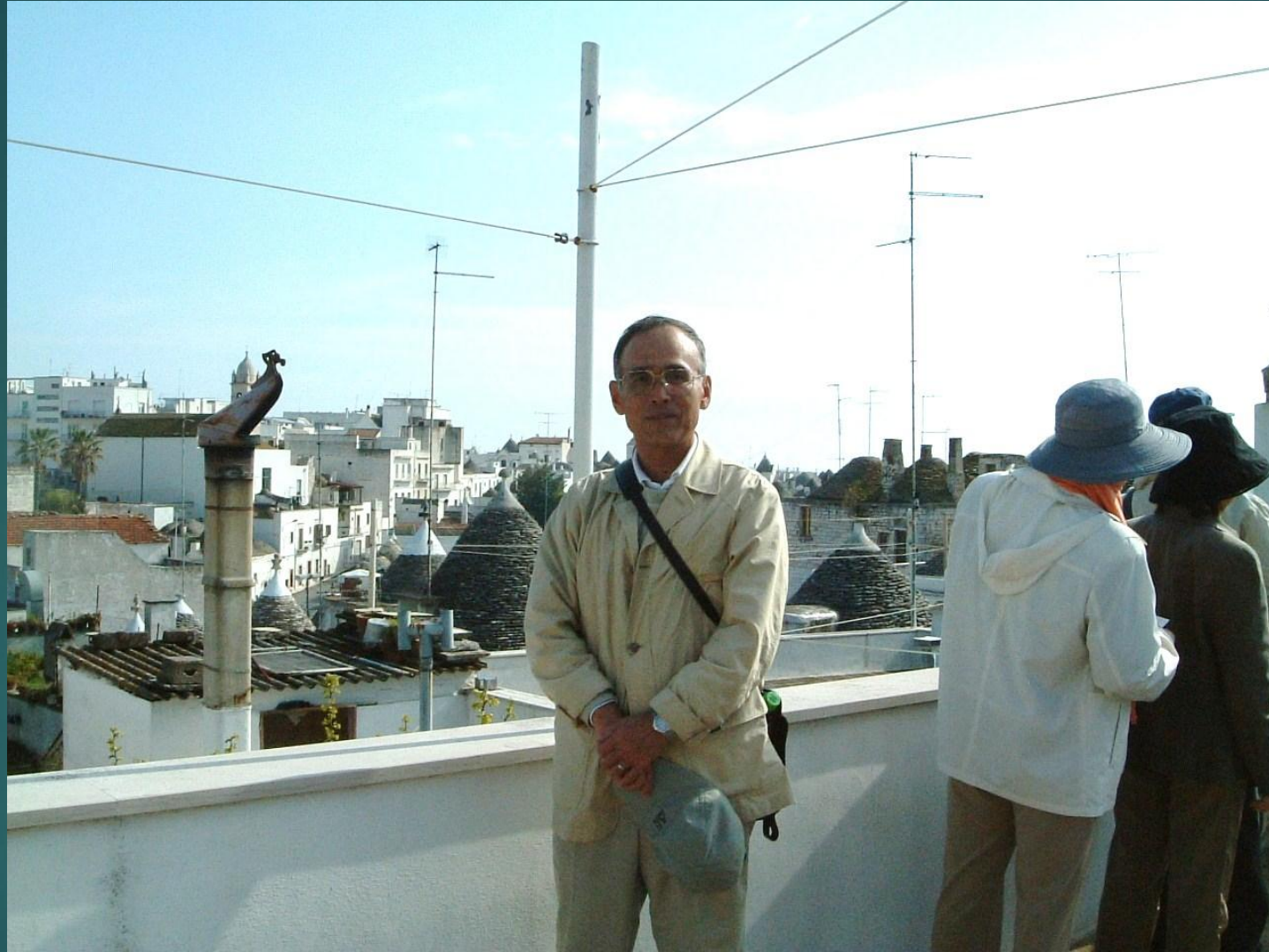
イタリア アルベロベッロ