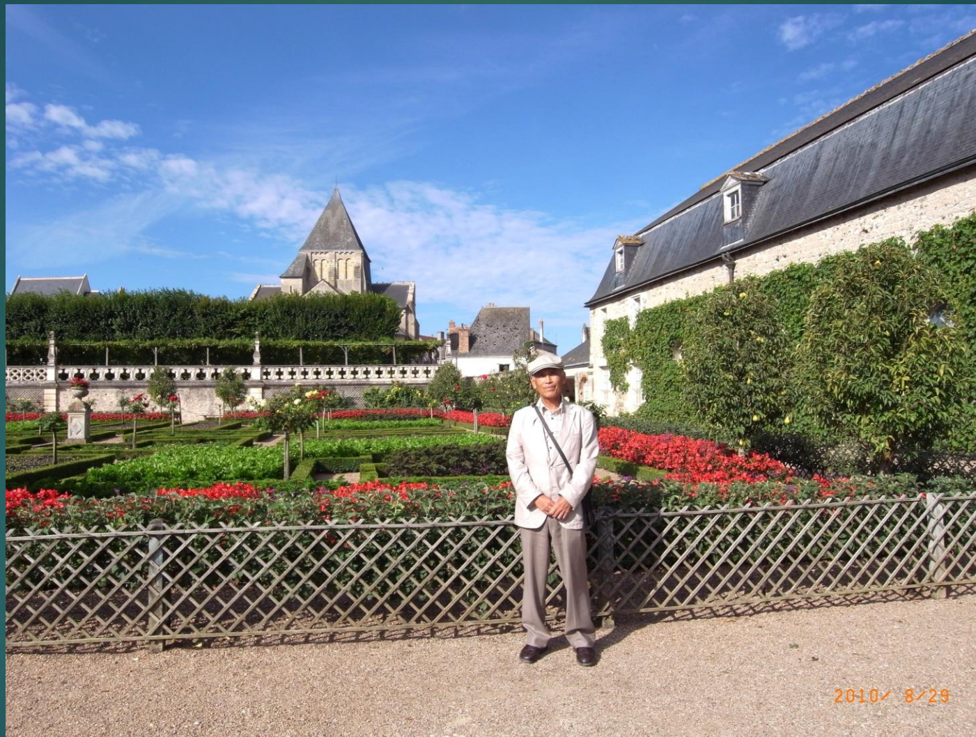
ヴィランドリー城 フランス