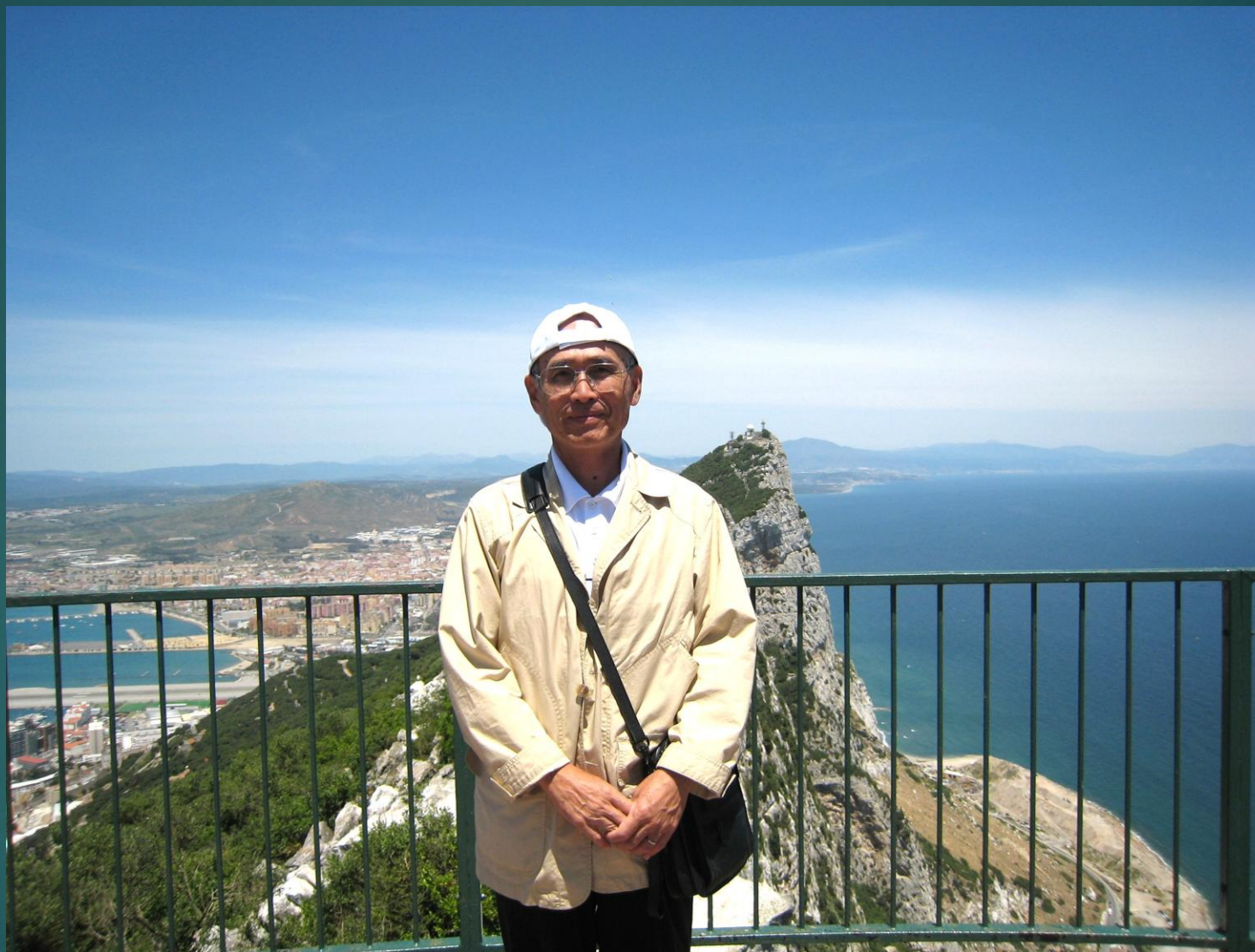
イギリス ジブラルタル