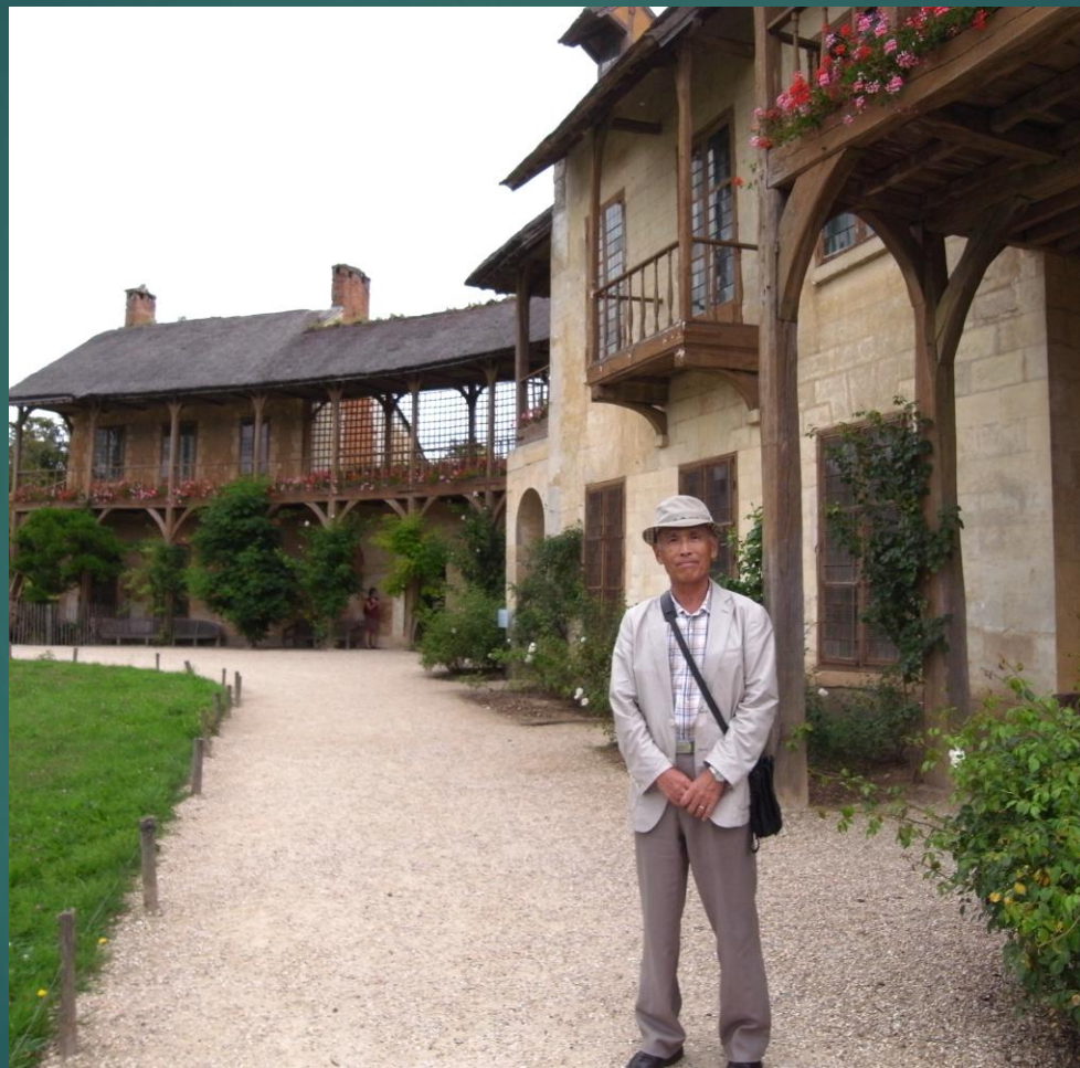
ベルサイユ宮殿 フォトリアン