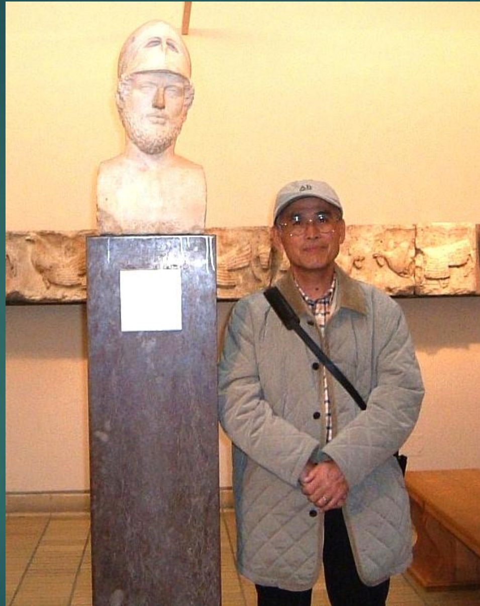
ロンドン 大英博物館