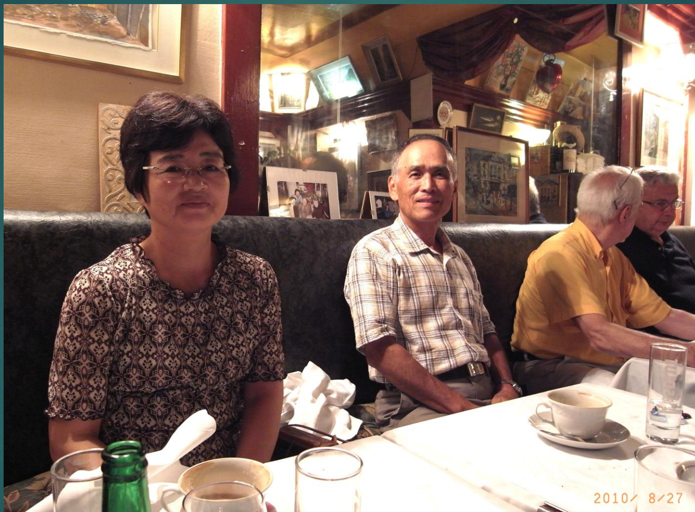
モンマルトルの丘 の レストラン