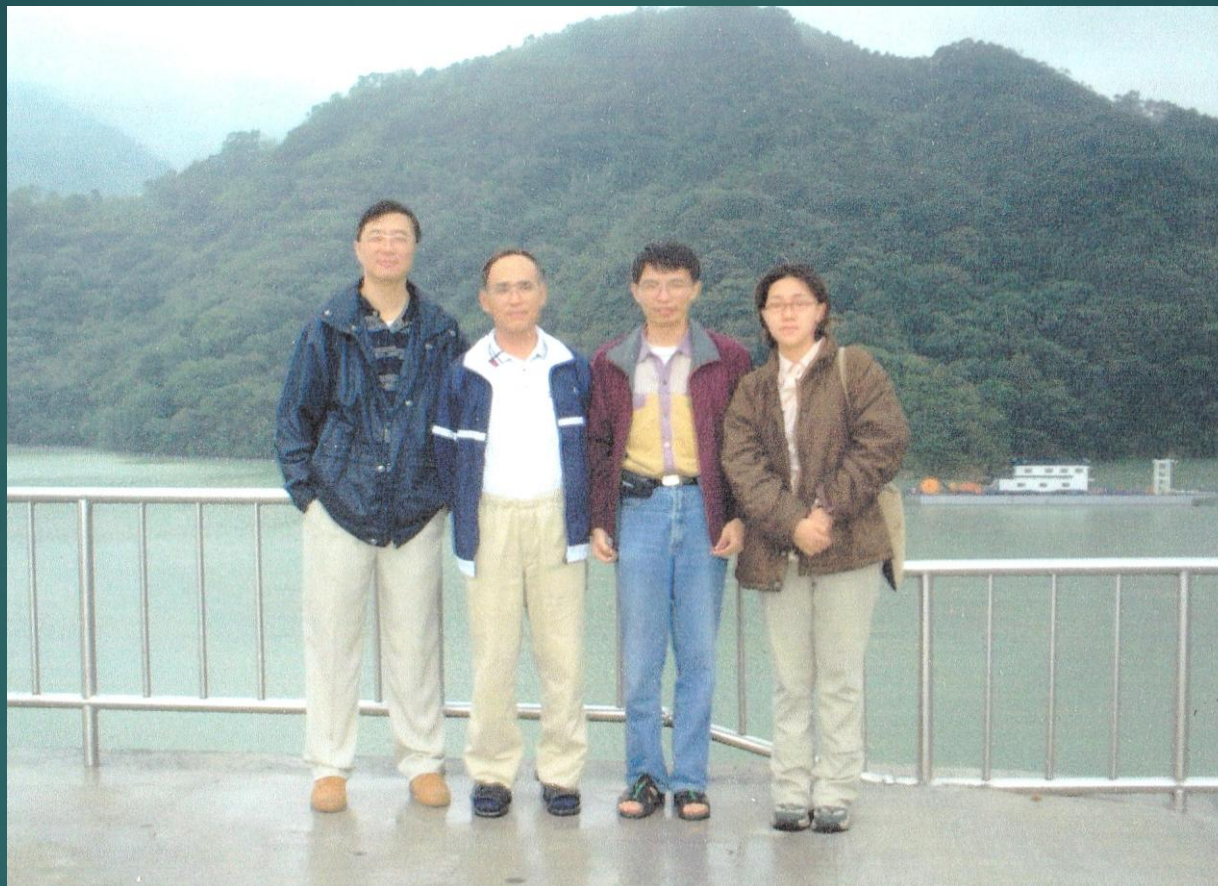
台湾 桃園 石門ダム